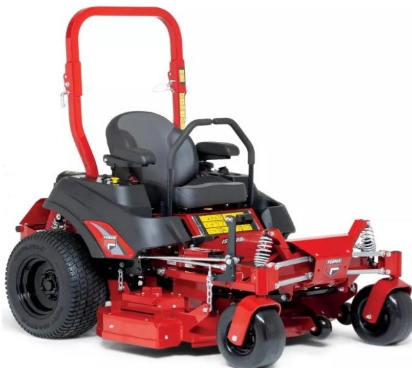
Rys 1. Zdjęcie pogładowe kosiarki Ferris ISX 800